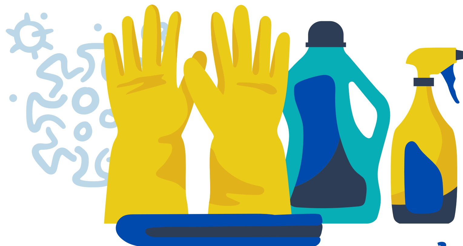
ທຳຄວາມສະອາດແລະຂ້າເຊື້ອ

ຖ້າທ່ານເປັນໄຂ້ ໃຫ້ຢູ່ໃນເຮືອນຂອງທ່ານ ແລະບໍ່ຕ້ອງອອກໄປ ຢູ່ທີ່ສາທາລະນະ