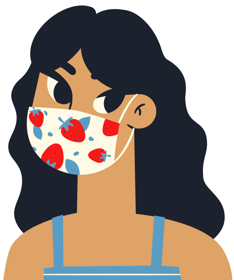
ໃຊ້ຫນ້າກາກຂອງທ່ານ